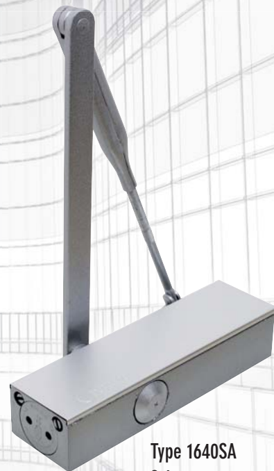
Type 1640SA Schaararm