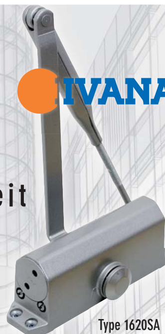
Type 1620SA Schaararm