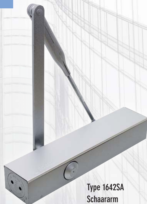
Type 1642SA Schaararm

SILVERLINE ® DEURDRANGERS ijzersterk merk van Ivana