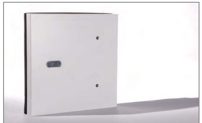
DOM AccessManager Siedle uitvoering